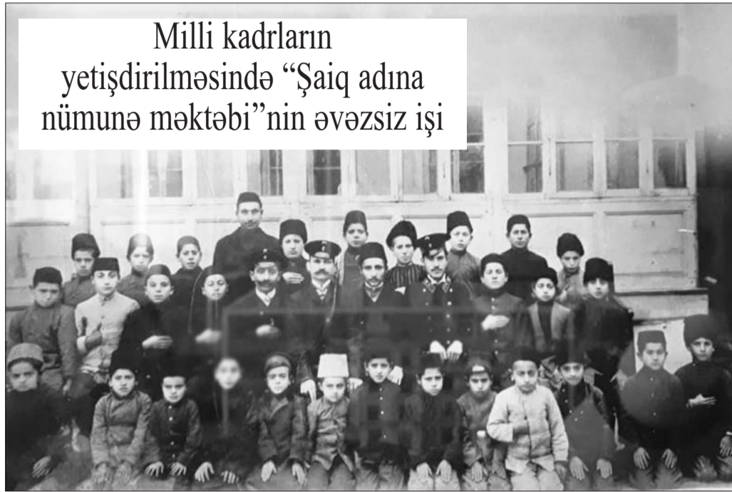
Milli kadrların yetişdirilməsində "Şaiq adına nümunə məktəbi"nin əvəzsiz işi